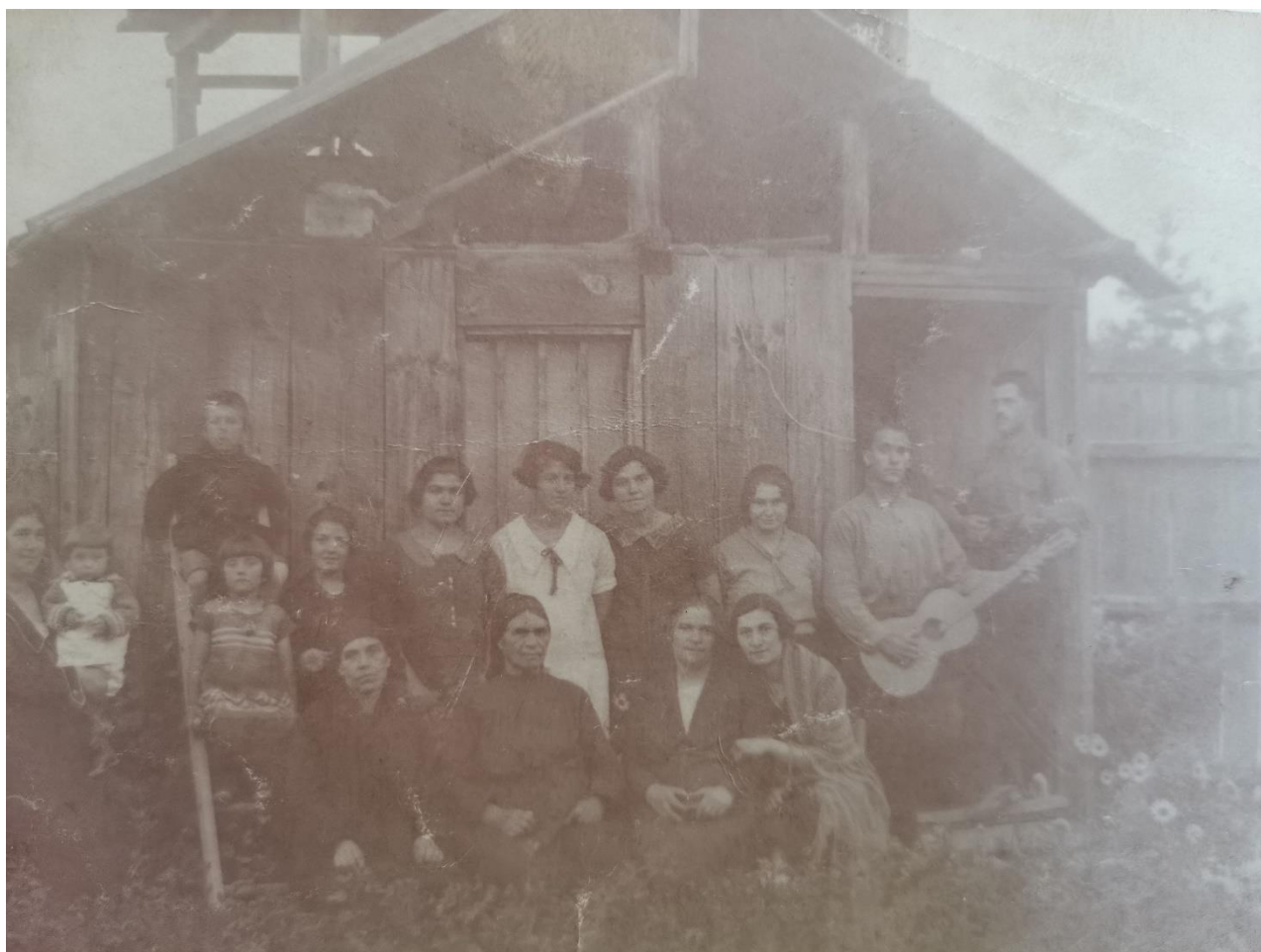
Групова снимка, направена при бараката в градината Лъджене с приятели и роднини 1920 г.