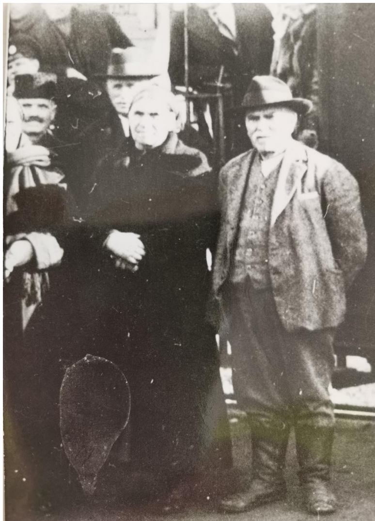
1936 г. на гара Велинград.